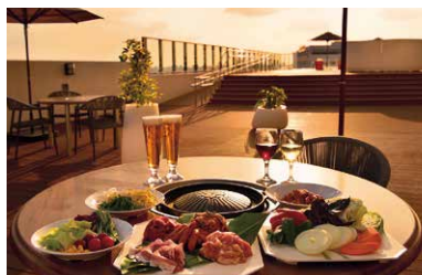
開放的なプールサイドでカジュアルにBBQ