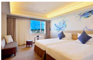
全室ハリウッドツイン 添い寝ができて安心