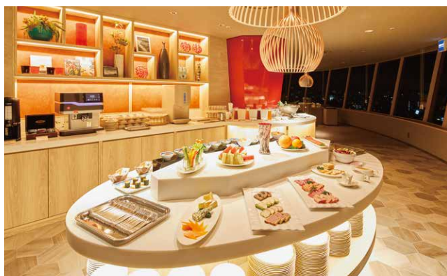
360度の景色を見渡せる最上階のプレミアラウンジでリラックスした時間を

さらに! 観光体験クーポン+共通クーポン お1人様 合計 4,000円 の クーポンがついてくる!