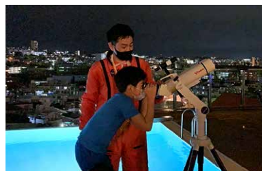
首里上空の星々を案内する「星あそび」開催中!