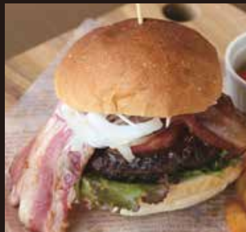
あぐーベーコンバーガー ¥1,900 OKINAWAN AGU PORK BACON BURGER

●FOOD/11:30 A.M. ~9:00 P.M. ●DRINK/10:00 A.M. ~9:00 P.M.